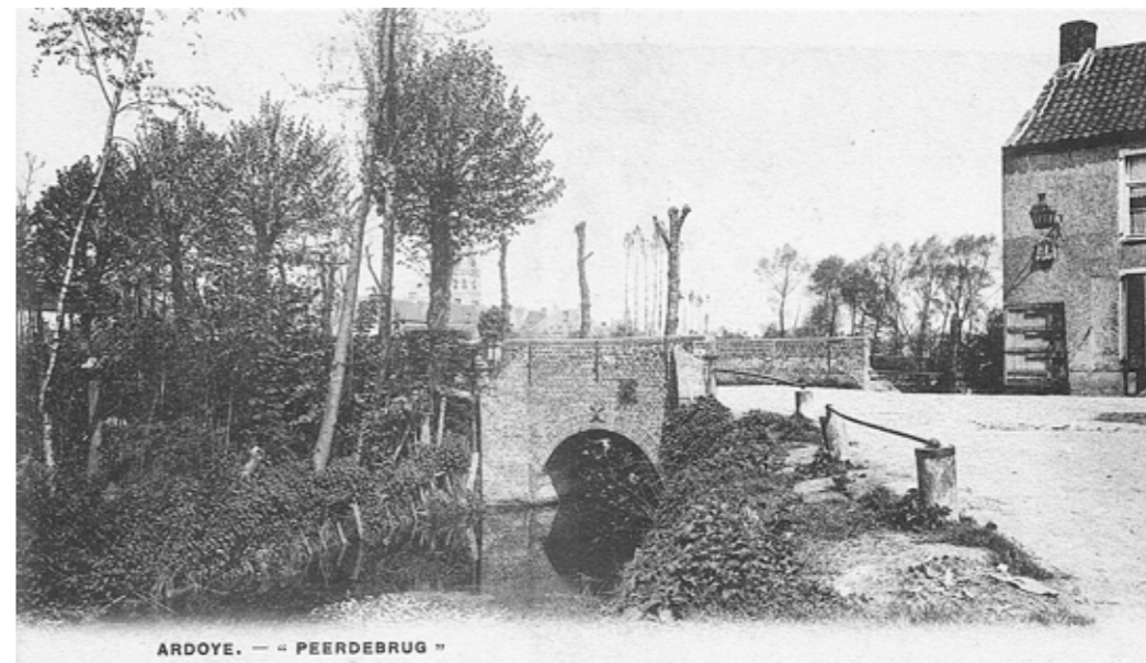
Peerdebrug, nu: Brugstraat ter hoogte van de Blekerijstraat

Het jaarboek is te koop aan € 15 in het gemeentehuis. U kunt dit bedrag ook storten op rekeningnr. BE55 7380 1497 9044 van de Heemkundige Kring Ardooisie-Koolskamp, met vermelding "Jaarboek2024+uwadres". Het jaarboek wordt u dan toegestuurd.